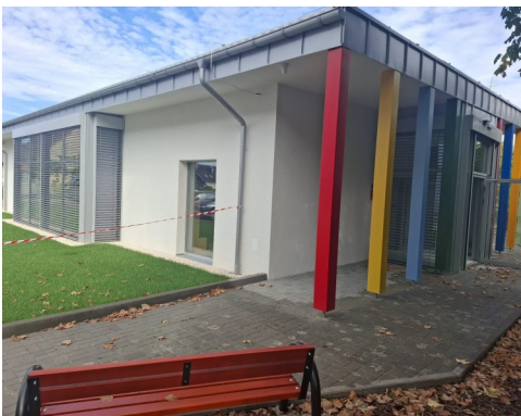
Nowy budynek oddziału przedszkolnego

Długo wyczekiwany przez wszystkich obiekt jest pod każdym względem wyjątkowy. Poza tym, że jest po prostu bardzo ładny, jest także energooszczędny. Dzięki zastosowaniu technologii pasywnych charakteryzuje się minimalnym zapotrzebowaniem na energię, a tym samym niższymi kosztami utrzymania oraz pozytywnym wpływem na środowisko. Obiekt jest zeroemisyjny, będzie zużywał nie więcej niż 15 kWh/m 2 /rok. Źródłem ciepła jest pompa ciepła oraz wentylacja mechaniczna nawiewno-wywiewna z odzyskiem ciepła i gruntowym wymiennikiem ciepła - a wszystko to zasilane z instalacji fotowoltaicznej. Cały budynek posiada ogrzewanie podłogowe.