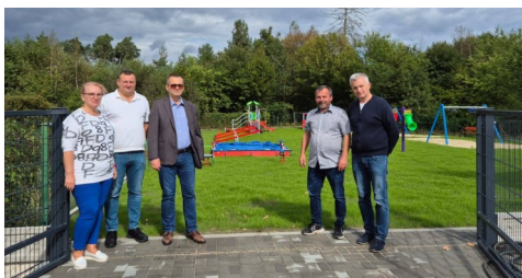
Nowy plac zabaw to część inwestycji

Przedszkole zostało zaprojektowane z myślą o komforcie i bezpieczeństwie dzieci, których może pomieścić ćwierć setki, zapewniając im idealne warunki do nauki i zabawy. Obiekt to także milowy krok dla infrastruktury oświatowej gminy.