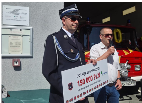
80-lecie OSP Fosowskie

Na początku lipca swoje święto obchodziła Dzielnica Fosowskie, z której historią jednostka Ochotniczej Straży Pożarnej jest nierozdzielnie związana. Druhowie z Fosowskiego od 80 lat dbają bowiem o bezpieczeństwo mieszkańców tej części Kolonowskiego—i właśnie dlatego obie uroczystości połączono. W części oficjalnej programu przewidziano ślubowanie nowych członków Dziecięcej i Młodzieżowej Drużyny Pożarniczej oraz przekazanie OSP przez Burmistrza Kolonowskiego czeku o wartości 150 tys. zł na zakup samochodu strażackiego (o nowym samochodzie—poniżej). Po części oficjalnej druhowie i przyszedł czas na biesiadowanie i występy artystyczne.