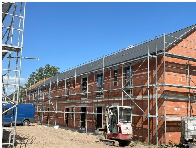
Prace idą pełną parą

Druki wniosku o zawarcie umowy najmu można pobrać ze strony internetowej Urzędu Miasta i Gminy Kolonowskie www.kolonowskie.pl lub pobrać w formie papierowej w pokoju nr 6, w siedzibie Urzędu Miasta i Gminy w Kolonowskim przy ul. Ks. Czerwonki 39.