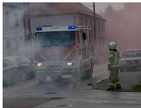
Uroczyste powitanie nowego wozu

Jednostka ze Staniszc Wielkich pozyskała także środki w wysokości 51 600 zł z Wojewódzkiego Funduszu Ochrony Środowiska i Gospodarki Wodnej w Opolu. Zostaną one przeznaczone na doposażenie jednostki w quada z przyczepką—niezastąpionego podczas akcji w terenie.