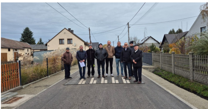
Uroczyste otwarcie zmodernizowanej ul. Guznera w Spóroku

Spóraczką ulicę przebudowano na odcinku o długości 775 metrów. Ma ona obecnie 4,5 metra szerokości, nową nawierzchnię położono na ulepszonym podłożu i podbudowie z kruszywa a zjazdy do posesji wykonano z betonowej kostki. Koszt inwestycji wyniósł 1 380 290,39 zł, z czego 676 185,99 zł pochodziło z Rządowego Funduszu Rozwoju Dróg.