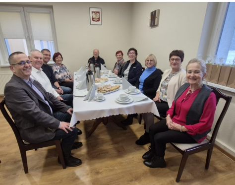
Spotkanie z przedstawicielami Bělota

W trakcie przedświątecznej wizyty, poza podsumowaniem 25-letniej współpracy, Burmistrz Beilrode, Rene Vetter zaprosił na przyszły rok do niemieckiej miejscowości Orkiestrę Dętą Colonnowska. Zobowiązano się także do wymiany doświadczeń w zakresie zarządzania energią.