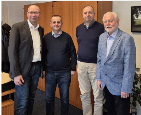
Wizyta w Beilrode