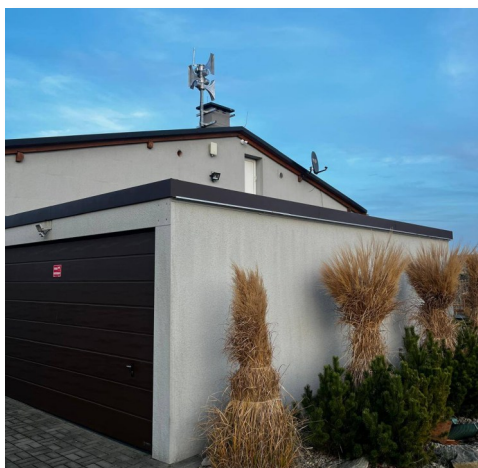
Syrena na dachu OSP Staniszcze Wielkie

21 listopada Druhowie z Ochotniczej Straży Pożarnej w Staniszczach Wielkich uroczystie powitali nowy sprzęt – quada, który wzmocni działania ratownicze na terenie sołectwa. Zakup pojazdu to inwestycja w bezpieczeństwo mieszkańców, ponieważ pozwoli on na dotarcie w trudno dostępne miejsca. Nie byłby on możliwy bez wsparcia ze strony Wojewódzkiego Funduszu Ochrony Środowiska i Gospodarki Wodnej w Opolu.