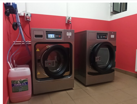
Zestaw piorący w OSP Kolonowskie

W połowie listopada na dachach jednostek OSP Staniszcze Wielkie i Kolonowskie pojawiły się nowe syreny. Dźwięk alarmu będzie się różnił od dotychczasowego, a syreny mają także możliwość nadawania komunikatów głosowych. Urządzenia służą do powiadamiania strażaków OSP i do ostrzegania ludności