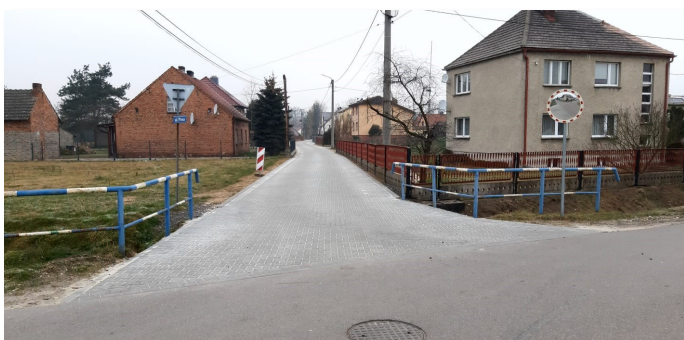
Ul. Prusa w Staniszczech Małych

Jeśli wszystko pójdzie zgodnie z planem, w przyszłym roku nowe nawierzchnie i chodniki zyskają gminne ulice m. in. w Fosowskim i Spóroku, przebudowana zostanie część sportowa w Miejskim Centrum Sportowo-Kulturalnym, a w okolicach szkoły w Kolonowskim pojawi się street workout park.