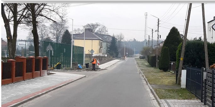
Chodnik przy ul. Szkolnej w Kolonowskim

Święta Bożego Narodzenia to wyjątkowy okres w roku. Niech płynąca z nich radość doda nam siły i otuchy, potrzebnej w przeżywaniu trudnego czasu niepewności i lęku, a nadchodzący Nowy Rok pozwoli na powrót do normalności, realizację wszystkich planów oraz spełnienie marzeń!